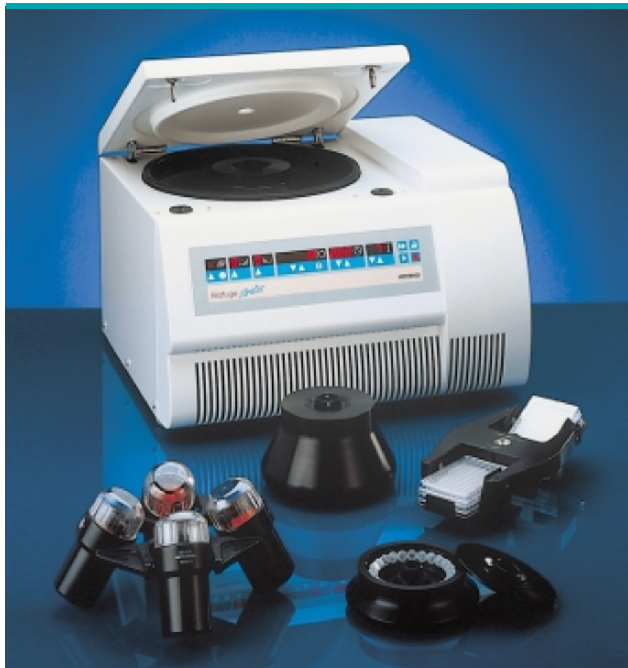
Die flexible High-speed Tischzentrifuge Biofuge stratos

Vervollständigt wird das Zubehörprogramm mit einem 4 x 180 ml Ausschwingrotor für alle Standardgefäße und einem Rotor für 2 x 2 Mikrotiterplatten. Für Spezialanwendungen im Durchflußbetrieb steht ein autoklavierbarer Titanrotor zur Verfügung.