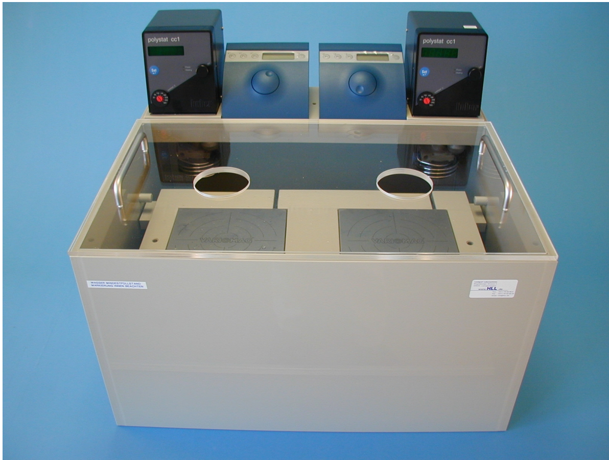
Abbildung SON03205 Inkubationsbad mit 2 Rührstellen und zwei Thermostaten